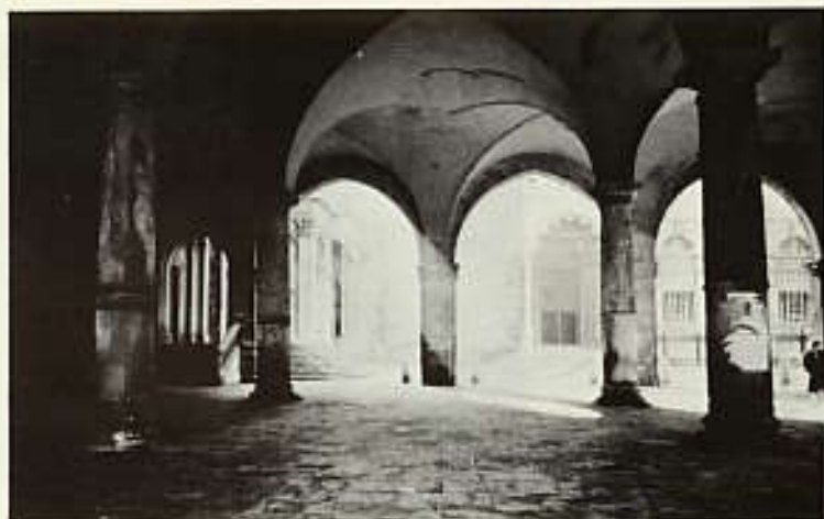
ヴェッキア広場から大聖堂広場を見も。View of Piazza del Duomo from Piazza Vecchia.