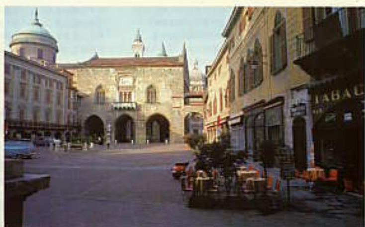
ヴェッキア広場, Piazza Vecchia square.