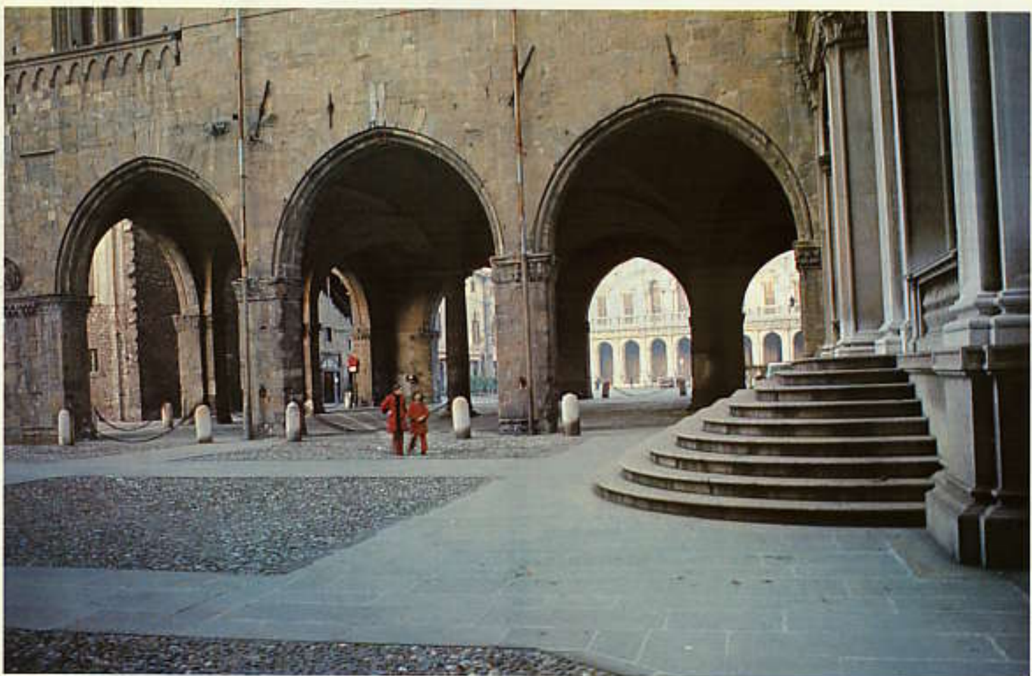
大聖堂広場, Piazza del Duomo.