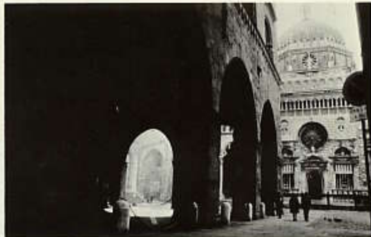
大聖堂広場への一般的なアプローチ。General approach to Piazza del Duomo.