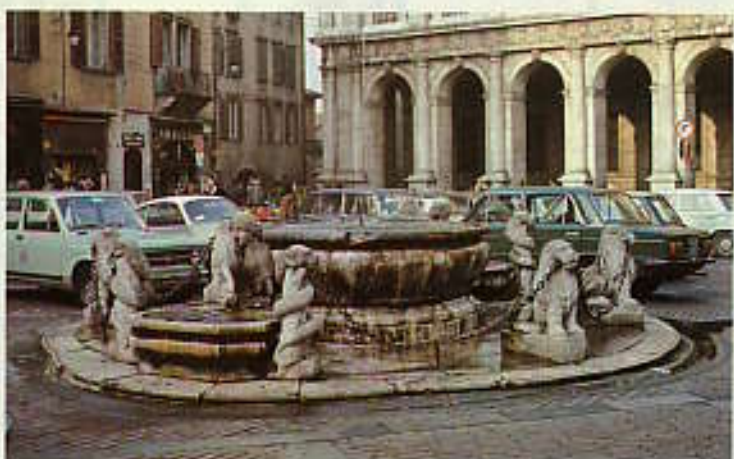
ヴェッキア広場の噴水, Fountain in Piazza Vecchia.