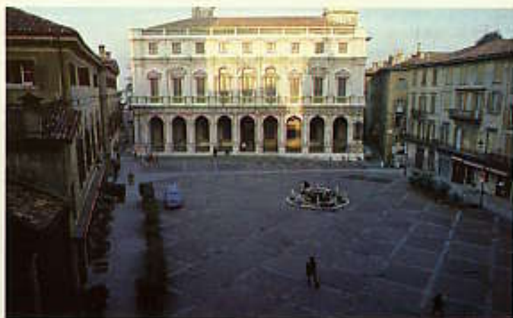
ヴェッキア広場と市立図書館（中央）を見る, View of Piazza Vecchia and city library (center).