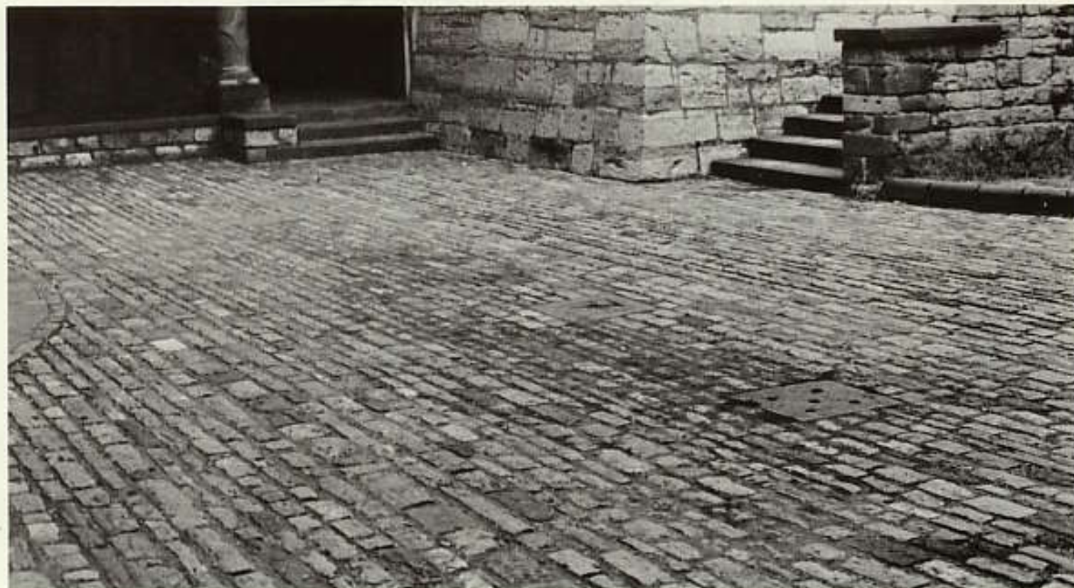
サンタ・マリア・マッジョーレ寺院裏手の敷石。Pavament in the rear of S.M. Maggiore.