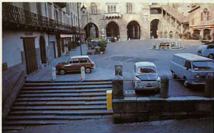
ヴェッキア広場, Piazza Vecchia.